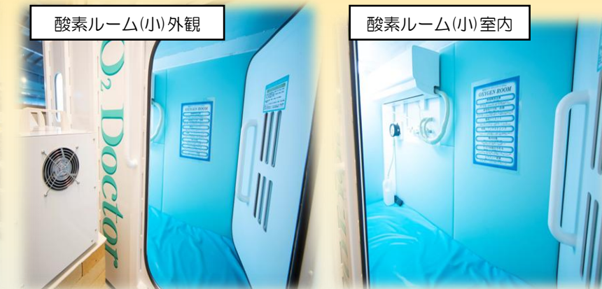
酸素ルーム(小) 室内